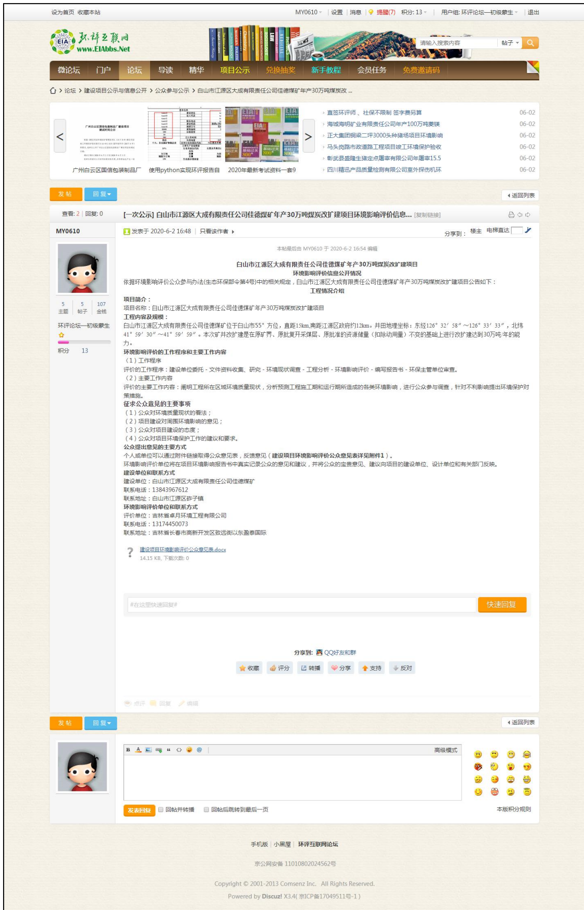
图 3-1 第一次网络公示截图