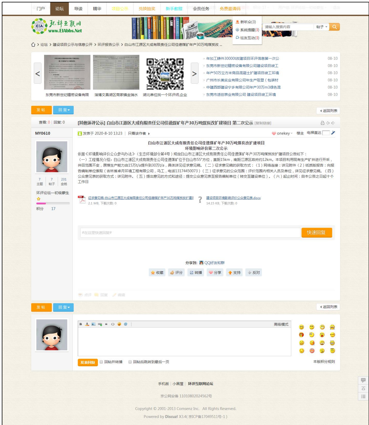
图 3-2 第二次网络公示截图