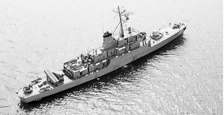
伊朗“厄尔布尔士”号驱逐舰(资料图)

亡,第4艘小船逃离了事发海域。对此,路透社援引胡塞武装发言人叶海亚·萨雷亚的话称,由于“马士基杭州”号上的船员拒绝听从警告,该组织对其发动了袭击,并称有10名胡塞武装人员在遭到美军袭击后“死亡或失踪”。当地时间2023年12月31日,丹麦外交部在社交媒体X发文称,该国外交大臣拉斯穆森表示,“对马士基船只的无端攻击是完全不可接受的。不幸的是,这凸显了红海的严峻局势”。