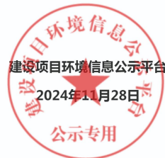
图 2.2-5 环境影响报告书征求意见稿网站公示截图