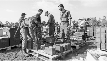
2日，以色列士兵在集结地打包弹药准备撤离。(视觉中国)

据半岛电视台2日报道，尽管以色列已开始从加沙北部撤出部分部队，但哈马斯和以色列之间的激烈战斗仍在继续，以色列军队对加沙中部和南部进行了猛烈轰炸。半岛电视台援引巴勒斯坦官员的话称，过去24小时，有200多名巴勒斯坦人死亡。 以军方发表部分撤军声明的当天，以色列最高法院否决了该国议会去年7月通过的削弱最高法院权力的法案。据以色列《国土报》报道，当地时间1日，最高法院的15名法官中有8人裁定该法案通过的法案无效。裁决文件称，“由于以色列作为民主国家核心价值，