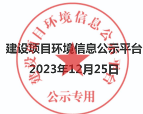
图 2.2-1 第一次网络公示截图