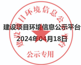
图 2.2-2 环境影响报告书征求意见稿网站公示截图