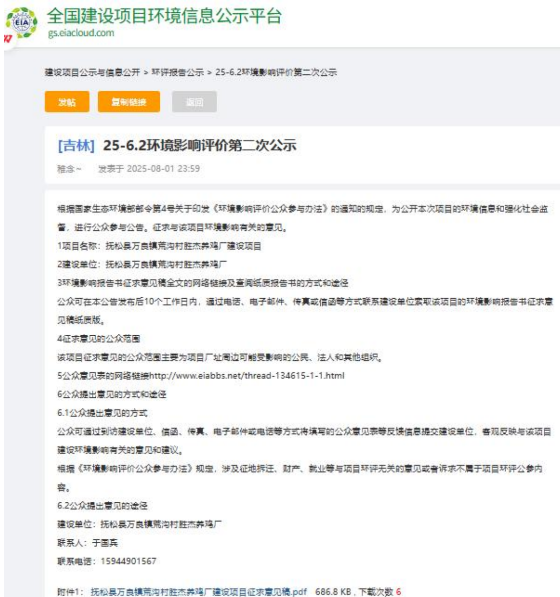
图 2-3 网络公示页面截图