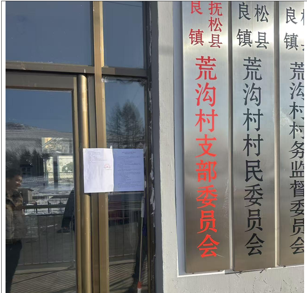
图 2-2 一次现场公告照片

告栏对项目环评同时进行了现场公告，为建设项目所在地公众易于接触的地点，符合《环境影响评价公众参与办法》（生态环境部令 第4号）中的相关要求。