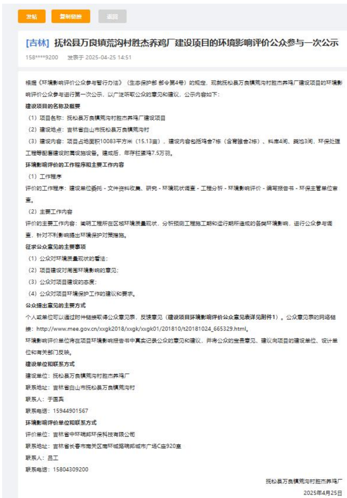
图 2-3 网络公示页面截图