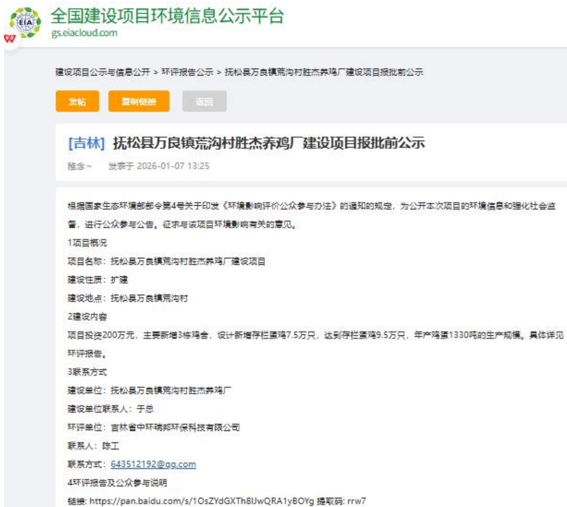
图 2-7 报批前公示截图

公示网址： https://www.eiacloud.com/gs/detail/1?id=60107Cywej