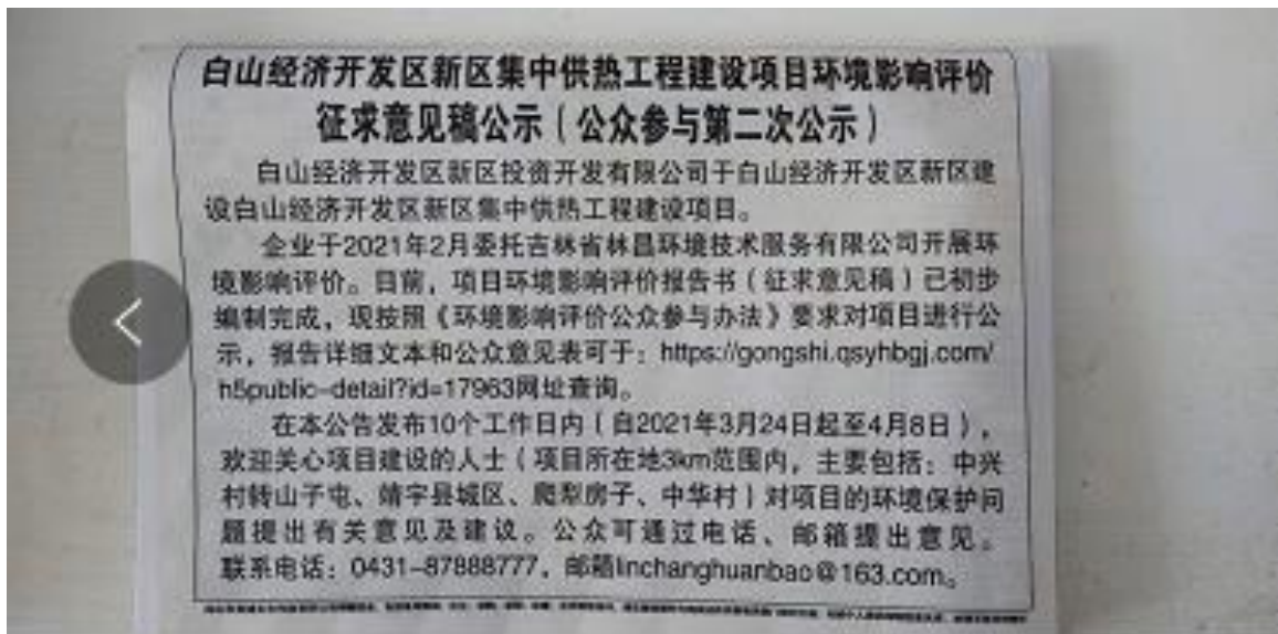
图 3-3 第二次报纸公示公示照片