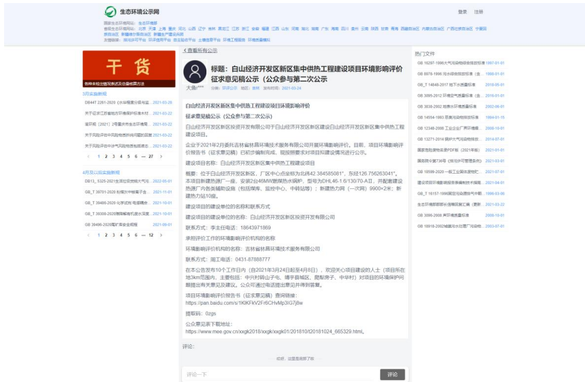
图 3-1 征求意见稿公示截图