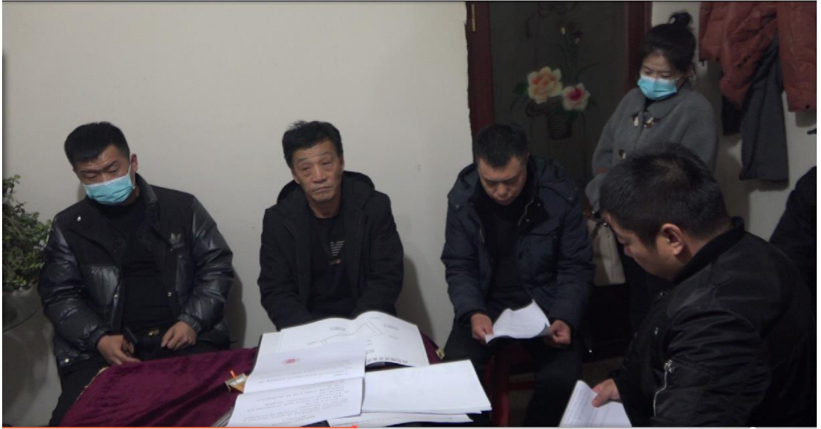
图 2-2 听证会现场照片