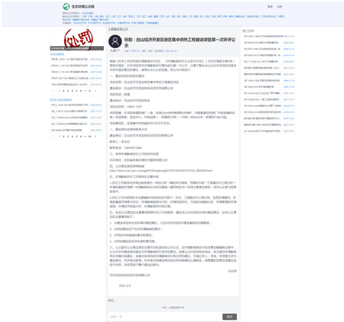
图 2-1 第一次网站公示截图